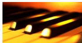
CARLES PUIG piano

SCOTT JOPLIN (1868 - 1917) RAGTIME DANCE