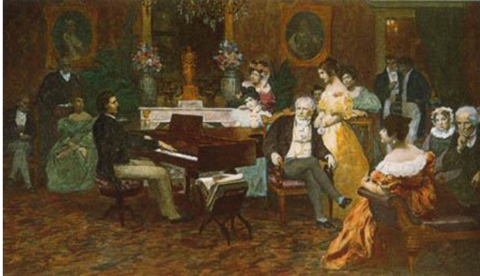
FREDERIC CHOPIN (Polònia, 1810 - França, 1849)